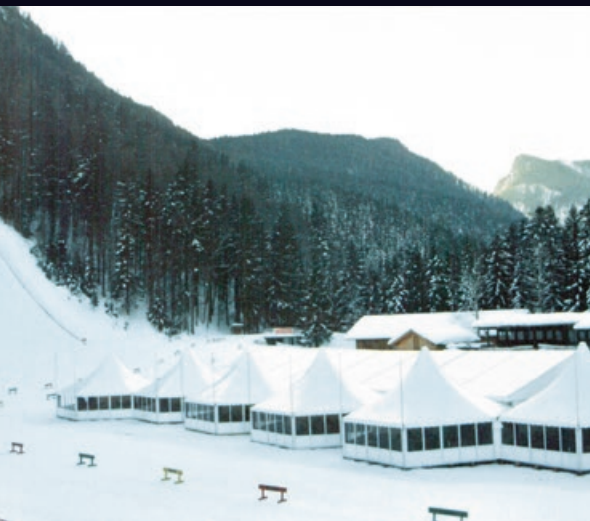
Biathlon Weltcup in Ruhpolding